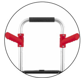
Incluye dos mangos ajustable